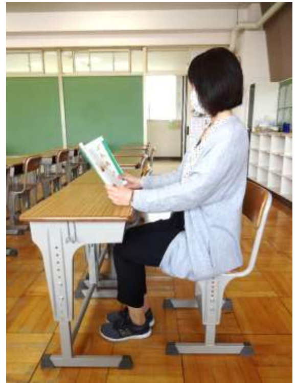
足のグーパー運動