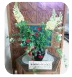
生け花ボランティアさんの作品