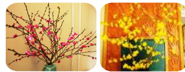
地域の方にいただいた紅梅と蠟梅