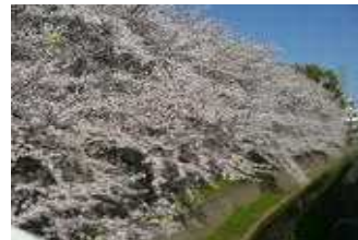
正門脇の満開の桜